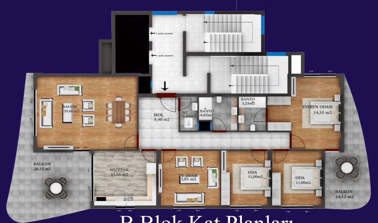
B Blok Kat Planları