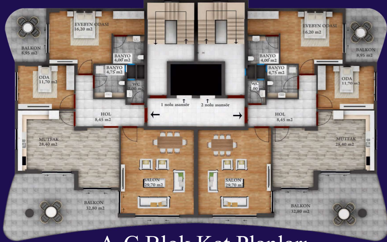
A-C Blok Kat Planları